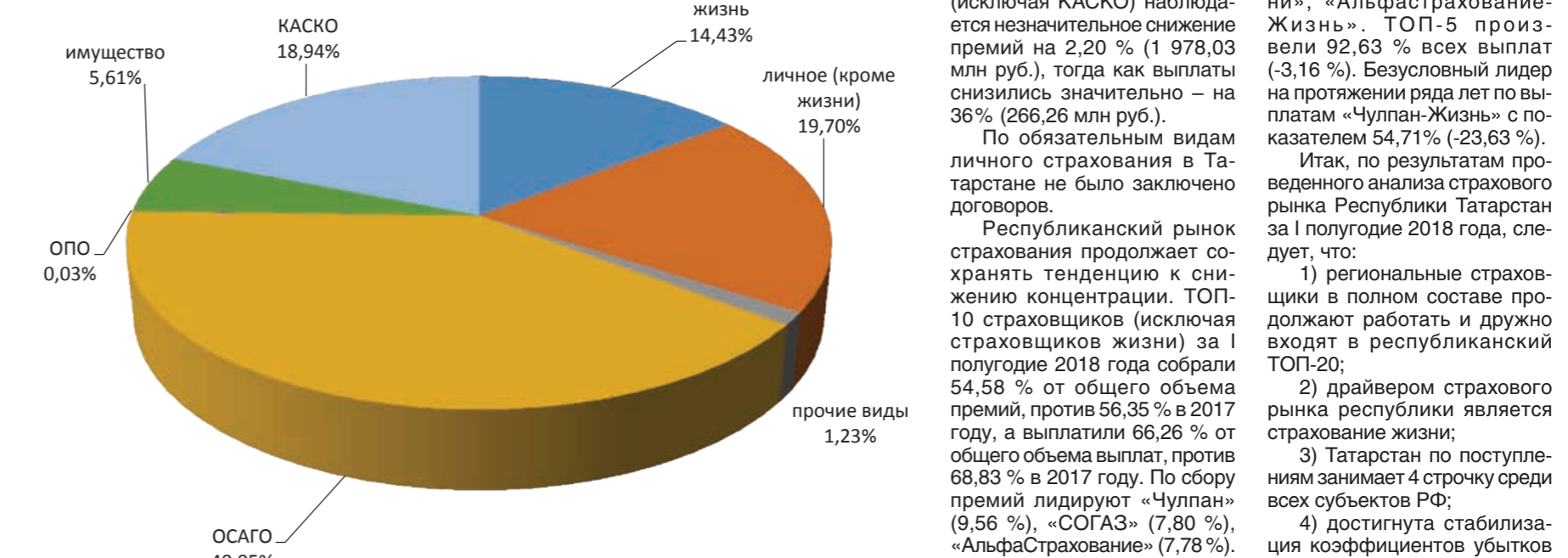
Структура страховых выплат РТ за I полугодие 2018 года

Республиканский рынок страхования продолжает сохранять тенденцию к снижению концентрации. ТОП-10 страховщиков (исключая страховщиков жизни) за I полугодие 2018 года собрали 54,58 % от общего объема премий, против 56,35 % в 2017 году.